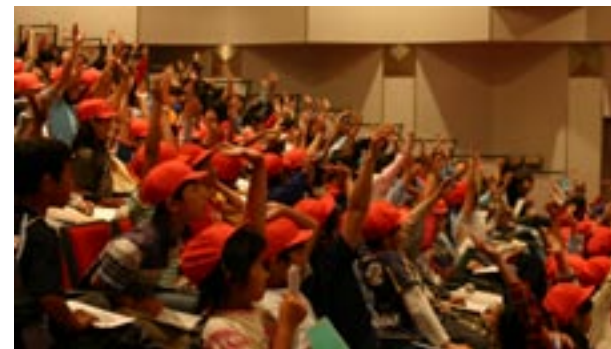
人と自然の博物館での学習からスタート（西山小&仁川小,2005）

この本をごらんになったみなさんが、ミヤマアカネやいろいろな生きものに興味を持ち、身近な自然を見なおしたり、友だちがふえるきっかけとなれば、うれしく思います。